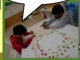
はらぺこあおむし 描くよ〜♪