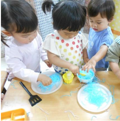
『春雨を使った感触遊び』みんな で何を作っているのかな？