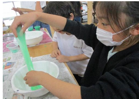
びよ～ん みんなでスライム作りに挑戦！！ えのぐを混ぜ込んで、カラフルな スライムがたくさんできました♪