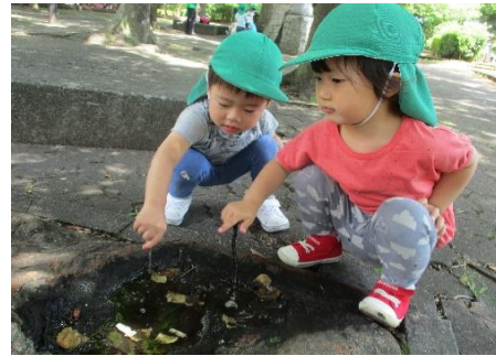
雨上がりのお散歩で水たまりを見つけたよ！ 「お魚いるかな？」と魚釣りを楽しみました。