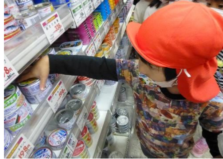
クッキング保育の材料買い出し！ ツナ缶ゲット♡