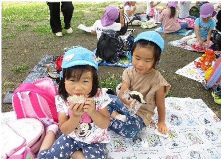
おにぎり散歩に行ってきました！ 外で食べるおにぎりはおいしいね！