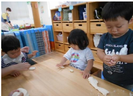
雨の日に感触遊びで小麦粉粘土をしました。 初めて触る感触に最初はなかなか手を伸ば そうとしない子どもたちでしたが、 楽しさが分かるとこねたり伸ばしたり 夢中になって遊んでいました。