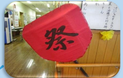
大きいうちわ 風も強力