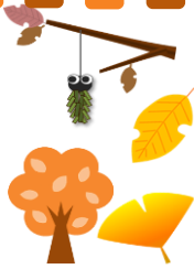
しおさい祭り出品作品☆