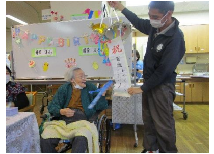
お誕生会をしました。 102歳おめでとう(*^-へ^-*)