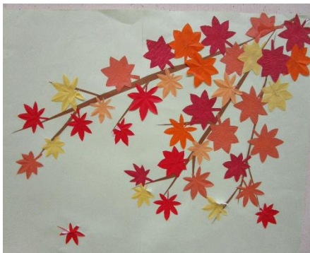
もみじ（ご利用者様作）

さて、先日「皆既月食」と「天王星食」が同時に見られました。なんと安土桃山時代以来442年ぶりで、次回このような惑星食が見られるのは322年後だそうです。月が赤銅色と呼ばれる赤黒い色に変わり、いつもと違う月に見とれてしまった方も多いのではないのでしょうか？このような自然現象には人を魅了する力がありますね。皆様も時々夜空を見上げてみてはいかがでしょうか？