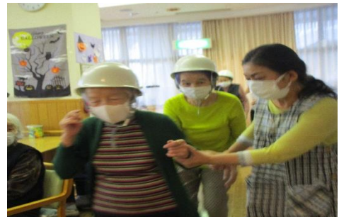
防災対策週間で避難訓練の様子です。 皆様にヘルメットをかぶってもらいました！